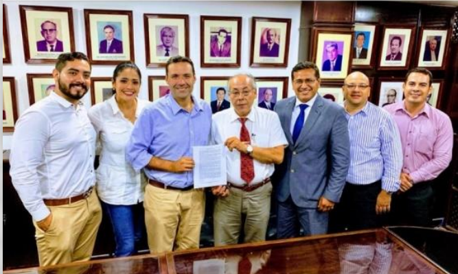
Reunión y Publicación del Manifiesto, en aval del Colegio de Abogados de Santa Cruz, de la Comisión de Firmas Legales, lo que sería la futura Cámara Boliviana Abogados y Firmas Corporativas el 15 de Junio de 2019.