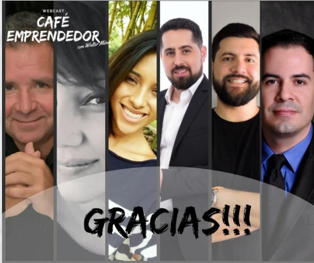
Ciclo de Entrevistas en Televisión Digital a especialistas de Startups en el canal de Emprendedores. 2018