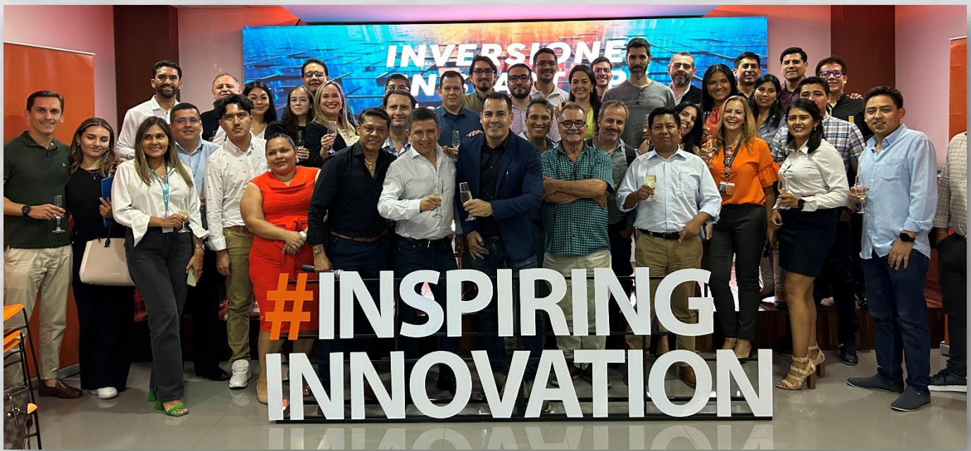
Organización del evento “Inversiones de Startups y el Contexto Internacional” de la Comunidad Fintech Bo en Santa Cruz el 15 de Marzo 2024