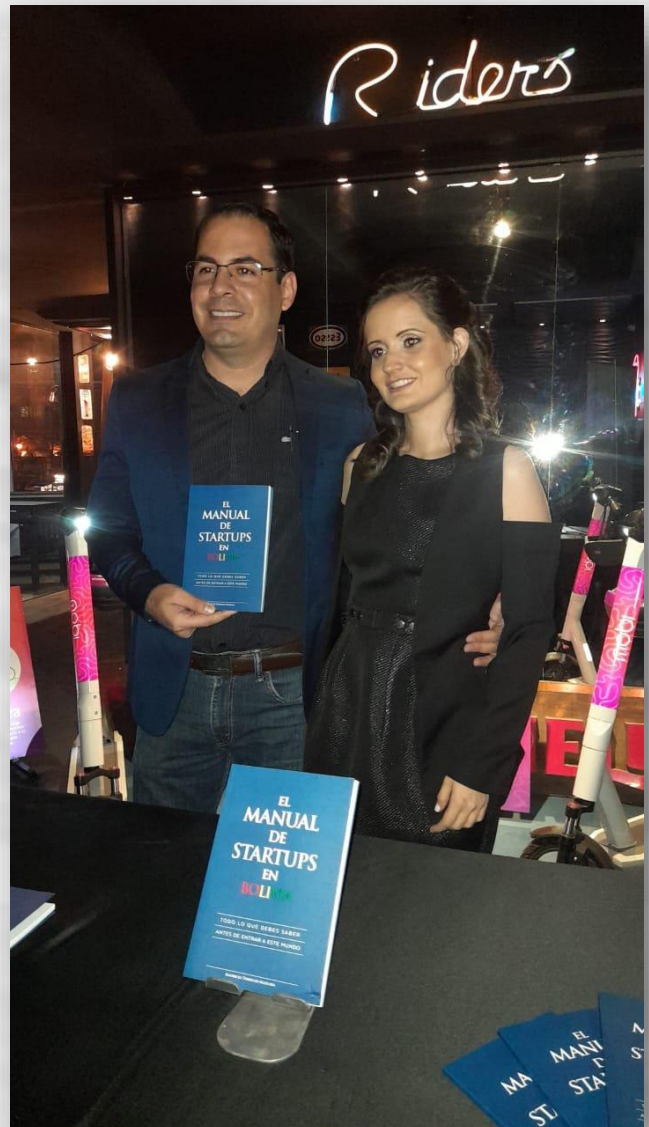
Lanzamiento del Libro “El Manual de Startups”, en Santa Cruz, 19 de Agosto de 2022