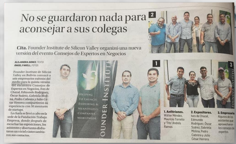
Evento del Founder Institute, de Silicon Valley-USA, de Capacitación en Presentación de Startups para Inversionistas PITCH, en Santa Cruz, 13 de Marzo 2019